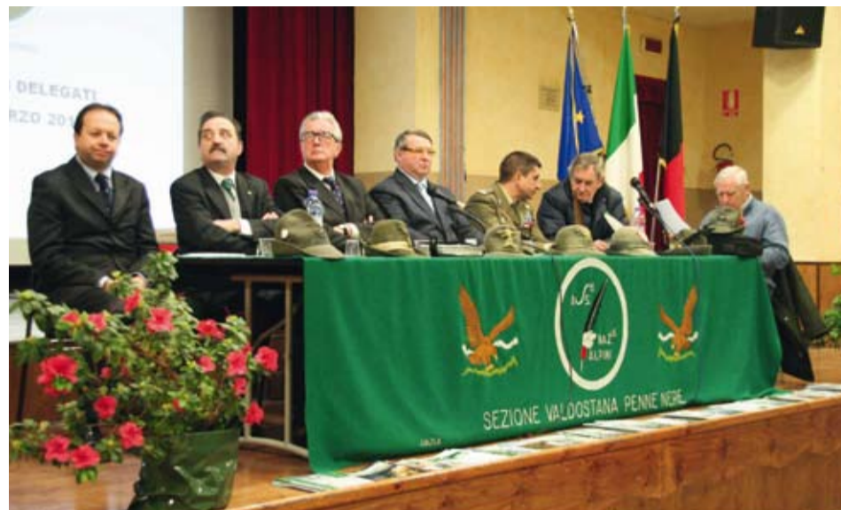
ASSEMBLEA DEI DELEGATI 2013 AOSTA, DOMENICA 3 MARZO 2013

La sezione valdostana a sostegno dei terremotati dell'Emilia e dell'Associazione Bambini Autistici