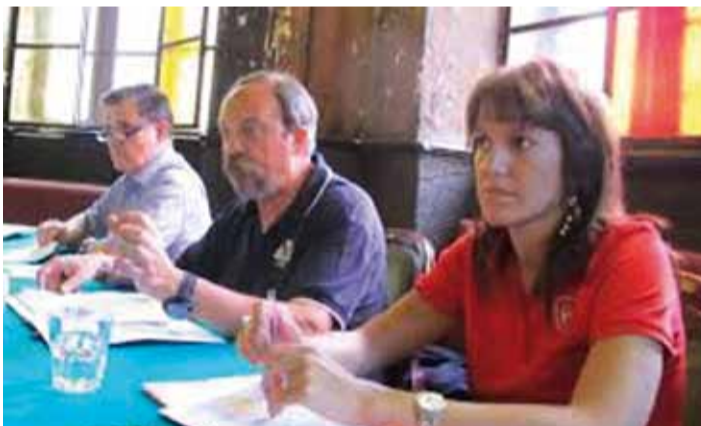
Ma esiste anche "Valle Responsabile"

Ed infine voglio portare all'attenzione dei lettori che durante il Convegno, promos-