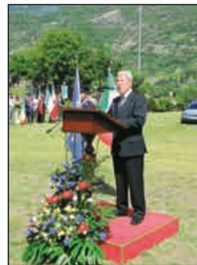
Il Questore Salvatore Aprile

sicurezza”. Parlando poi dell'attività della Polizia, il Questore di Aosta, che questa “deve evolvere con la naturale dinamica sociale ed assumere connotati sempre più indispensabili a rispondere alle crescenti esigenze della sicurezza. Ecco perché occorre operare una buona selezione del personale e contribuire alla sua formazione professionale dandogli gli strumenti necessari per metterlo in condizioni di agire con competenza ed efficienza. L'obiettivo - ha precisato - è di preparare operatori attenti, dinamici, propositivi che sappiano affrontare i problemi con un approccio creativo e formativo poiché il poliziotto deve agire con professionalità, fermezza e autorevolezza, senza dimenticare le regole dell'educazione, del buon senso e dell'intelligenza”. ●