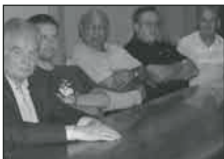
In alto quattro istantanee della riunione della sezione di Saint-Vincent. In basso a destra, i partecipanti all'appuntamento di Châtillon

- hanno precisato - proseguono ad un ritmo sostenuto, tanto che, con la fine di giugno, la via sarà restituita alla cittadinanza così come sarà messo a sua disposizione tra breve il parcheggio interrato". A buon punto anche la costruzione del Palazzetto dello sport, giunto in fase conclusiva, mentre la piscina esterna è pronta all'apertura per la stagione estiva. Tra le scadenze è stata segnalata la revisione del Piano regolatore generale per l'adeguamento alla norma-