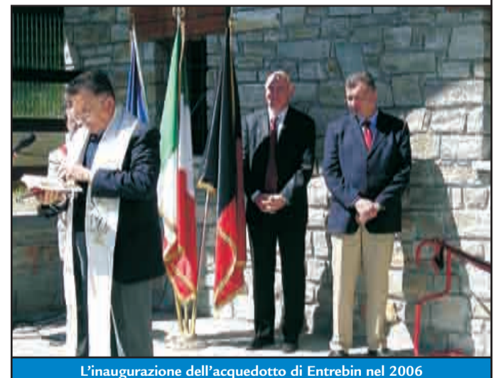
L'inaugurazione dell'acquedotto di Entrebin nel 2006